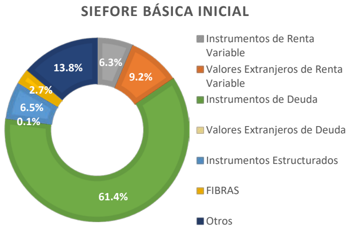
Datos estimados al cierre de noviembre de 2019

Para la Siefore Básica Inicial, la composición de la cartera se conforma mayoritariamente por instrumentos de Deuda (gubernamental y privados) y valores extranjeros de deuda, estos últimos de forma minoritaria; renta variable nacional y valores extranjeros de renta variable; en menor proporción se consideran instrumentos estructurados, FIBRAS y otros. Dicha asignación refleja una visión estratégica que es congruente con una Trayectoria de Inversión de largo plazo que considera las características demográficas de los Trabajadores.